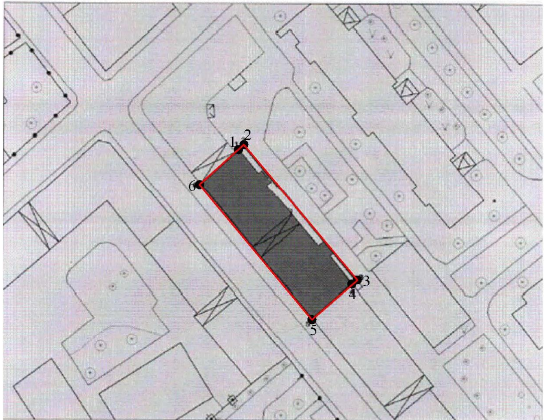
Схема границ территории объекта культурного наследия регионального значения (памятника) «Доходный дом К.С.Клингсланда, 1902 г., арх. Г.Н.Иванов», расположенного по адресу: г. Москва, Большой Козихинский переулок, д. 10