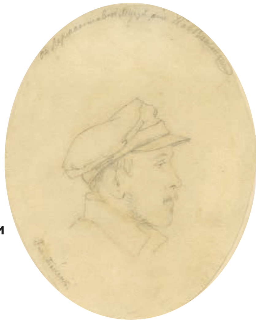
Михаил Лермонтов. Июль 1840 года. Единственный профильный портрет поэта. Карандашный рисунок выполнен штабс-капитаном бароном Д. П. фон дер Паленом в палатке обер-квартирмейстера Чеченского отряда барона Л. В. Россильона во время стоянки на берегу реки Сулак у Миатлинской переправы. Пушкинский Дом

Продолжая тему иконографии Михаила Лермонтова, начатую в прошлых номерах журнала, интересно обратить внимание на автора его единственного профильного портрета. Это изображение сделано вскоре после воспетого Лермонтовым кровопролитного боя с горцами 11 июля 1840 года на речке Валерик. Автором карандашного рисунка был вовсе не профессиональный художник, а соратник поэта штабс-капитан барон фон дер Пален.