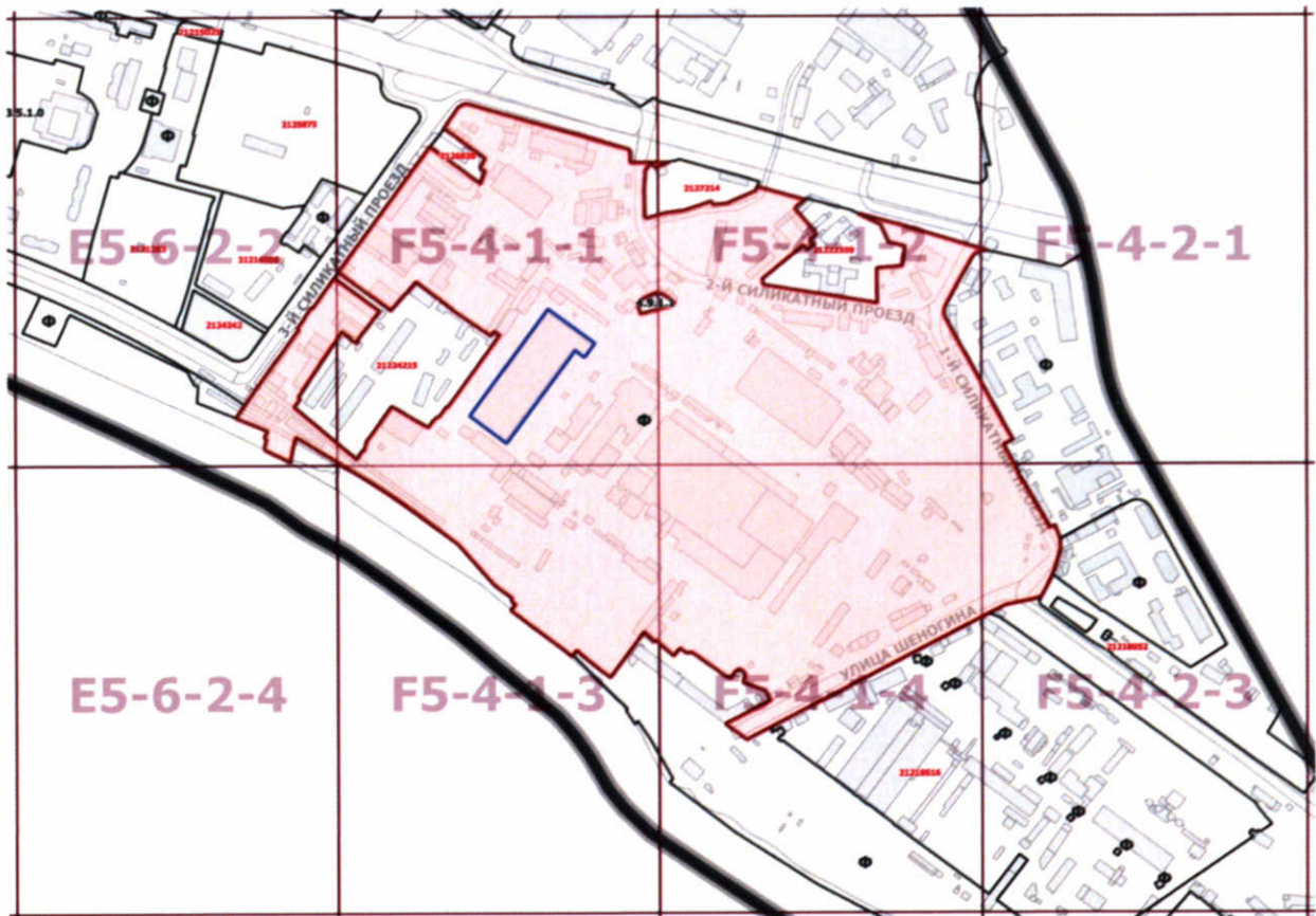
Схема границ подготовки проекта внесения изменений в правила землепользования и застройки города Москвы в отношении территории по адресу: ул. Шенюгина, вл. 2, СЗАО (кад. №77:08:0012003:13)